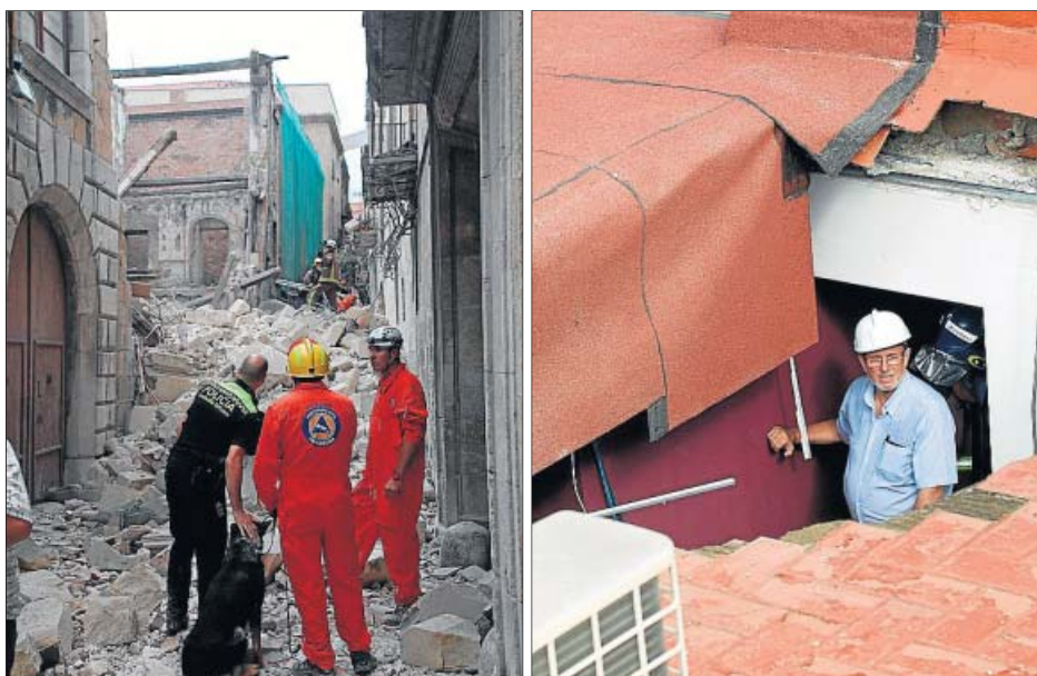
Els edificis ensorrats a Tarragona i Badalona (d'esquerra a dreta).

VILADECANS S'inaugura un 'ecoapar- cament' municipal. L'A- parcament Municipal de Ponent és, des d'ahir, el pri- mer ecoaparcament públic de Viladecans. Disposa de recàrrega elèctrica i solar i de reciclatge de vehicles.